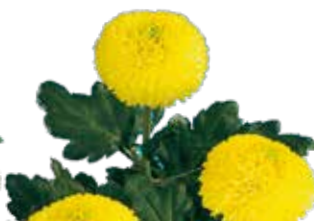
PING PONG GEEL