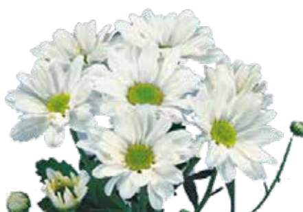
REAGAN WHITE ELITE