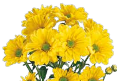
REAGAN SUNNY ELITE