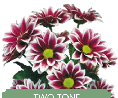
TWO TONE DARK PINK