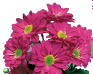
REAGAN DARK SPLENDID